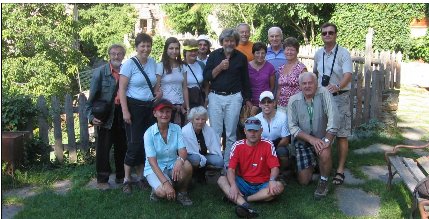
Setkání s legendárním horolezcem Reinholdem Messnerem.